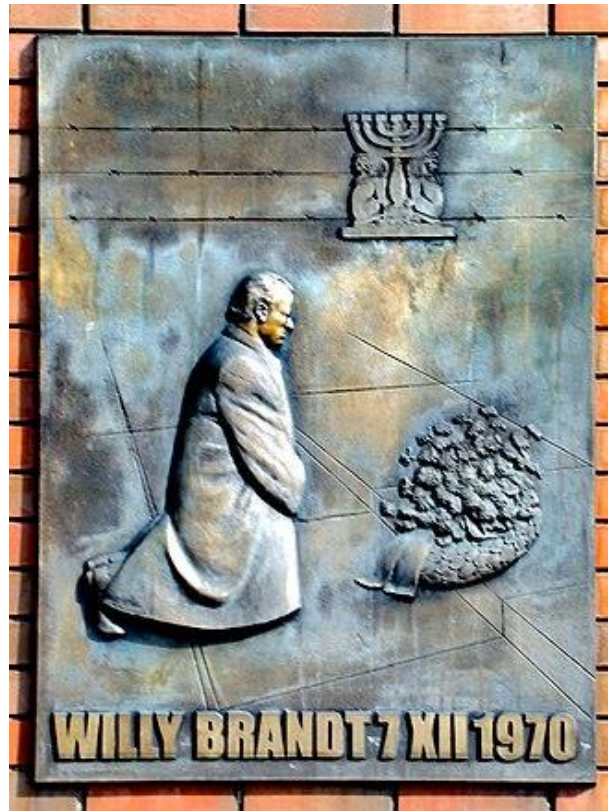
Bronzetafel am Denkmal des Kniefalls

Vergebung: dass bei in unserer Gesellschaft wieder Juden leben und Synagogen bauen und Teil unseres Lebens in Deutschland sind, ist für mich ein pures Wunder.