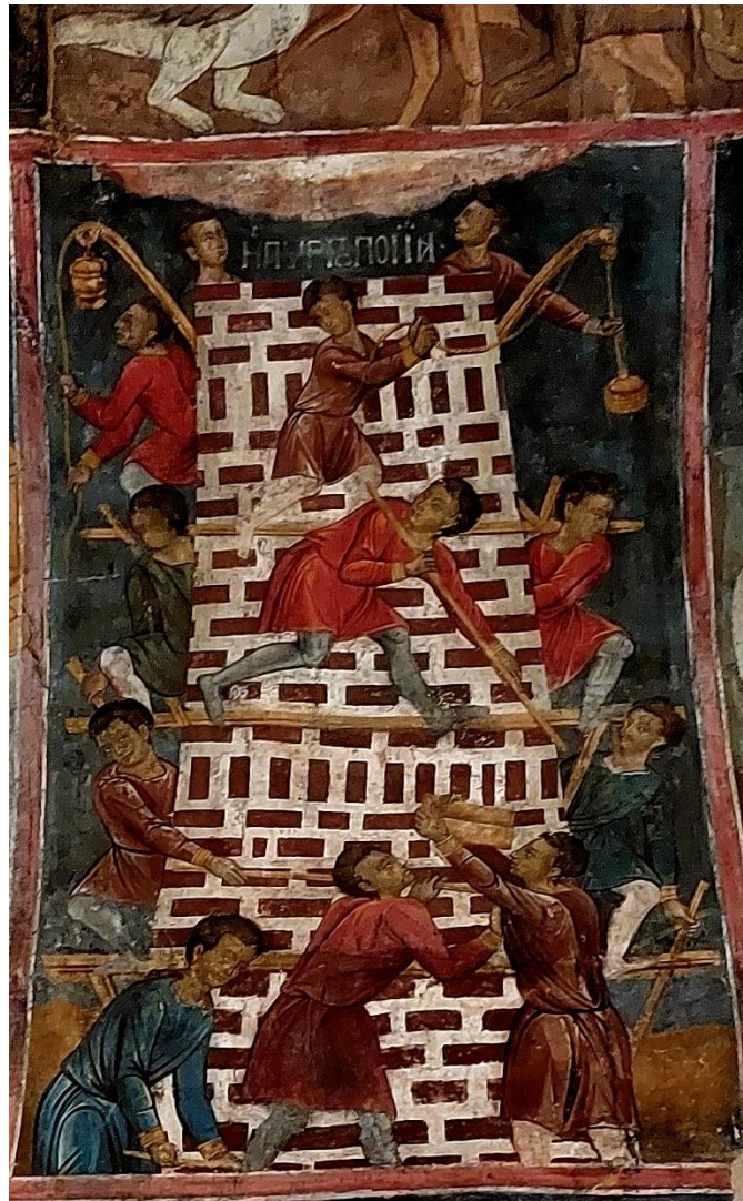
Fresko aus Ioannina